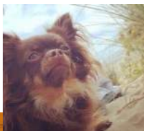
1 Le "Lion"