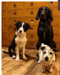
2 Punto, Youki, Loca